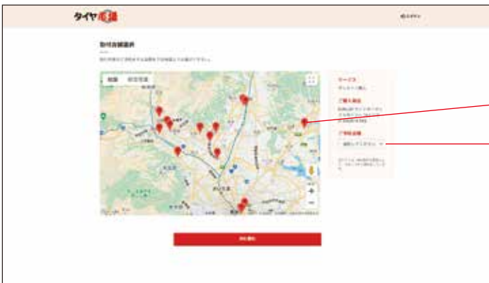
取付店舗選択画面